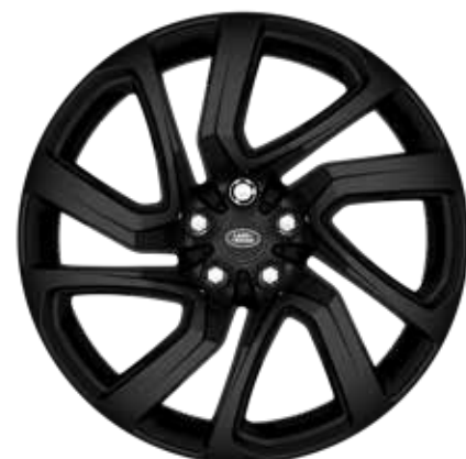
21" スタイル5025、5スプリットスポーク、 グロスブラック