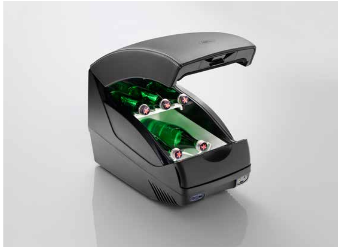
センターアームレスト クーラー/ウォーマー ボックス

長期の家族旅行に便利なドリンク・フードキャビネット。上質なレザートップは、センターアームレストとしても使用できます。センターシートベルトで固定し、リアの電源ソケットに接続して使用します。