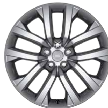
21" スタイル5123、5スプリットスポーク、 スパークルシルバー