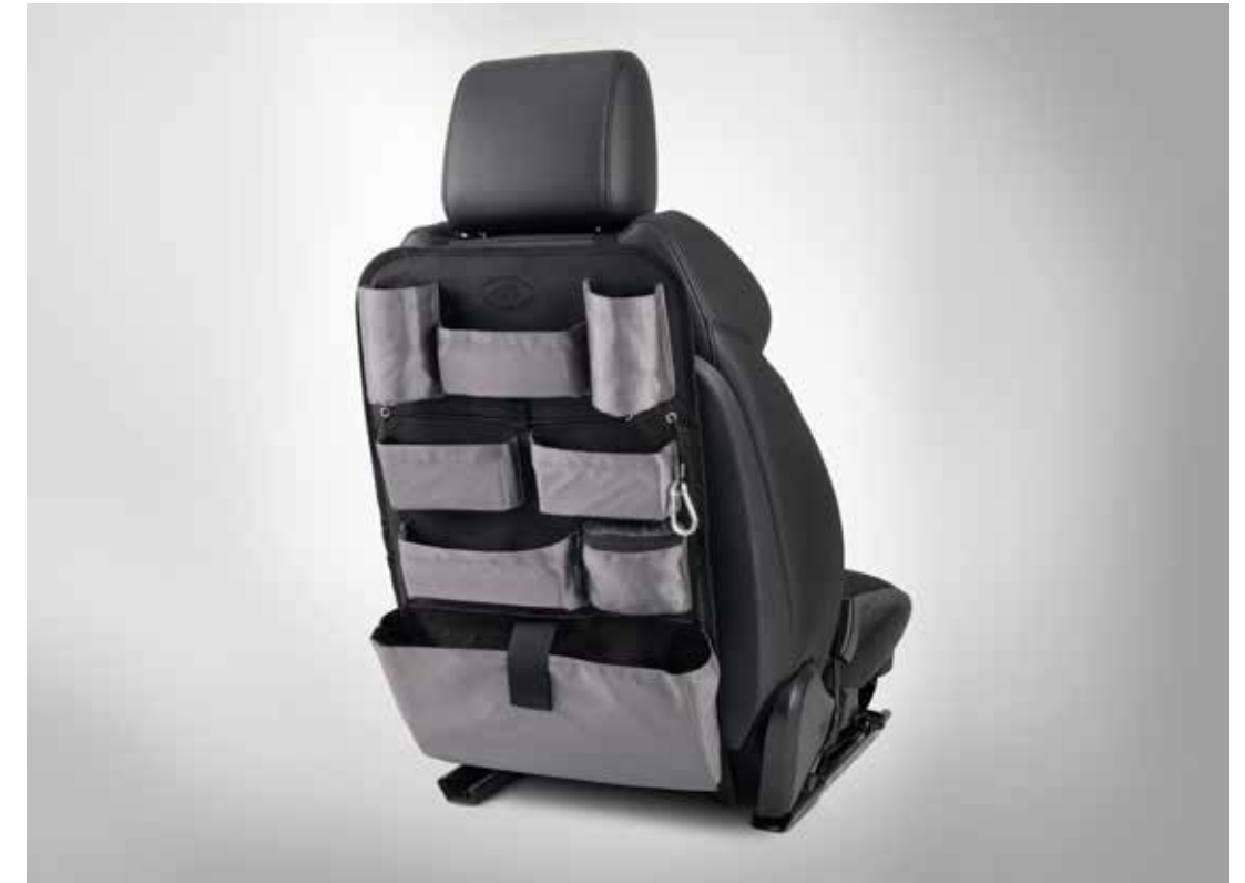
シートバックストイッジ

車の内装レザーと同じグレードのウインザーレザーを使用したストレージポケット。フロントシートバックに取り付けます。ソフトタッチのライニングを使用し、マグネットのバックルが付いています。