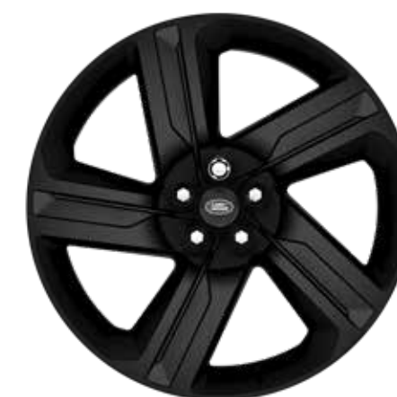
22" スタイル5124、5スプリットスポーク、 グロスブラック