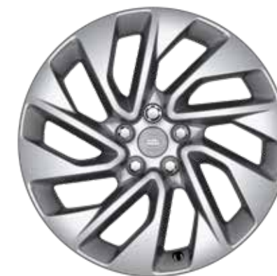
20" スタイル5122、5スプリットスポーク、 スパークルシルバー