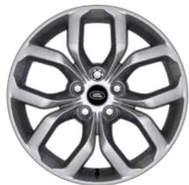
19" スタイル5021、5スプリットスポーク、 スパークルシルバー

現代的でダイナミックなデザインのアロイホイールのバリエーションで、あなたのクルマにさらなる個性を。