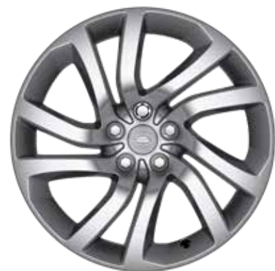
20" スタイル5011、5スプリットスポーク、 スパークルシルバー