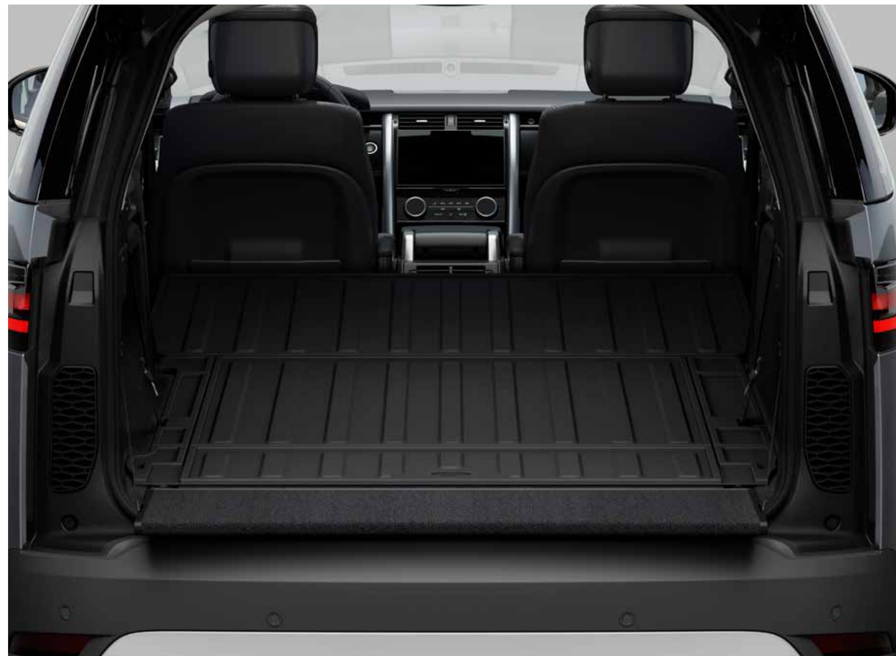
ロードスペース ラバーマットエクステンション

'LAND ROVER'ロゴ入りのウォータープルーフラバーマット。縁の立ち上がりがロードスペースのカーペットをさまざまな汚れから守ります。