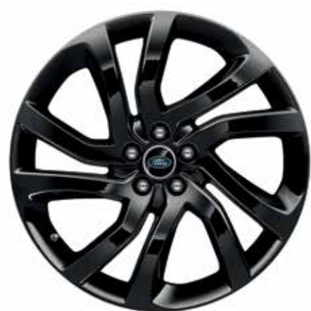
22" スタイル5011、5スプリットスポーク、 グロスブラック