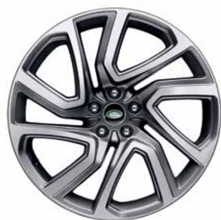
22" スタイル5025、5スプリットスポーク、 ライトシルバーダイヤモンドターンドフィニッシュ