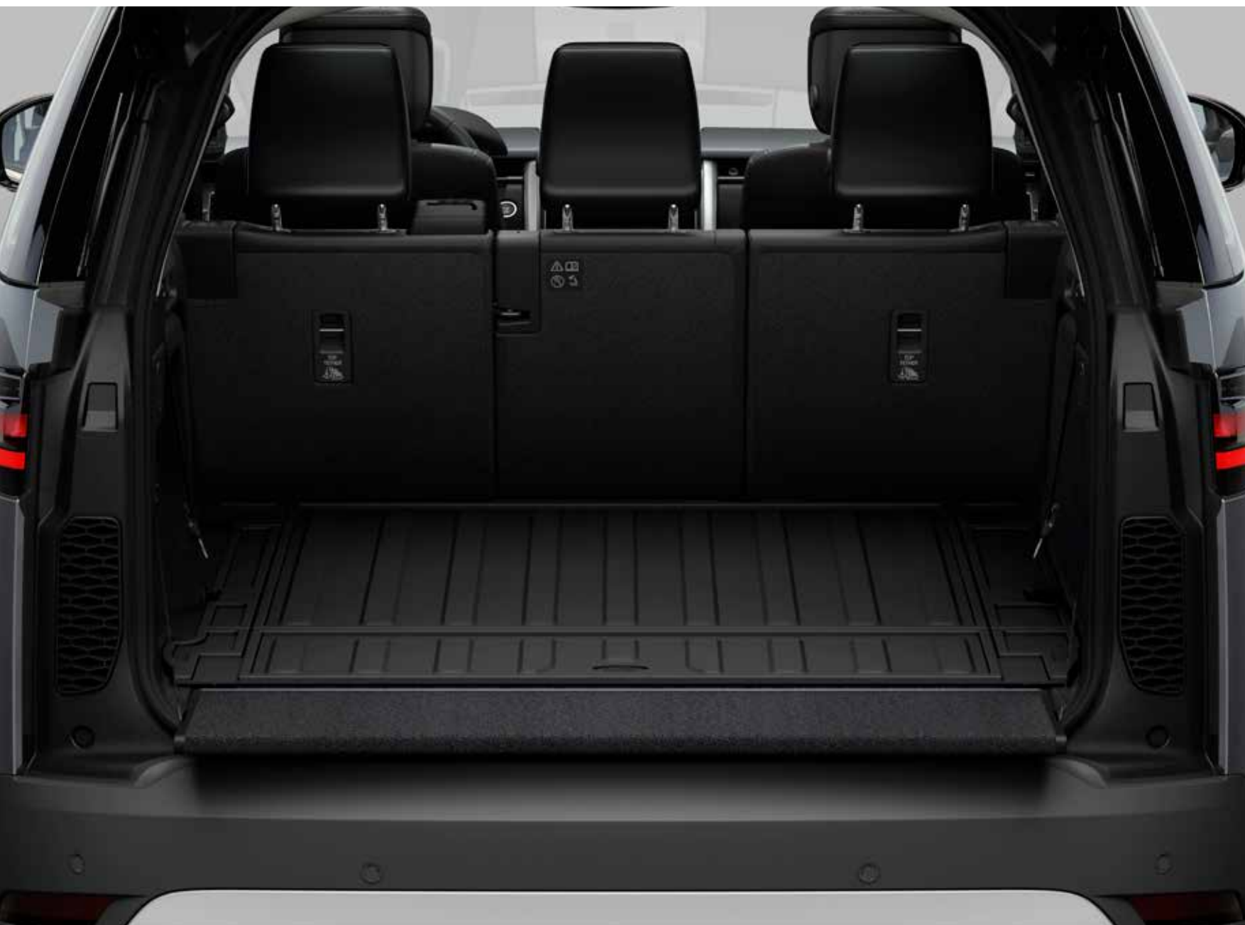
ロードスペース パーマット

'LAND ROVER'ロゴ入りのウォータープルーフラバーマット。縁の立ち上がりがロードスペースのカーペットをさまざまな汚れから守ります。