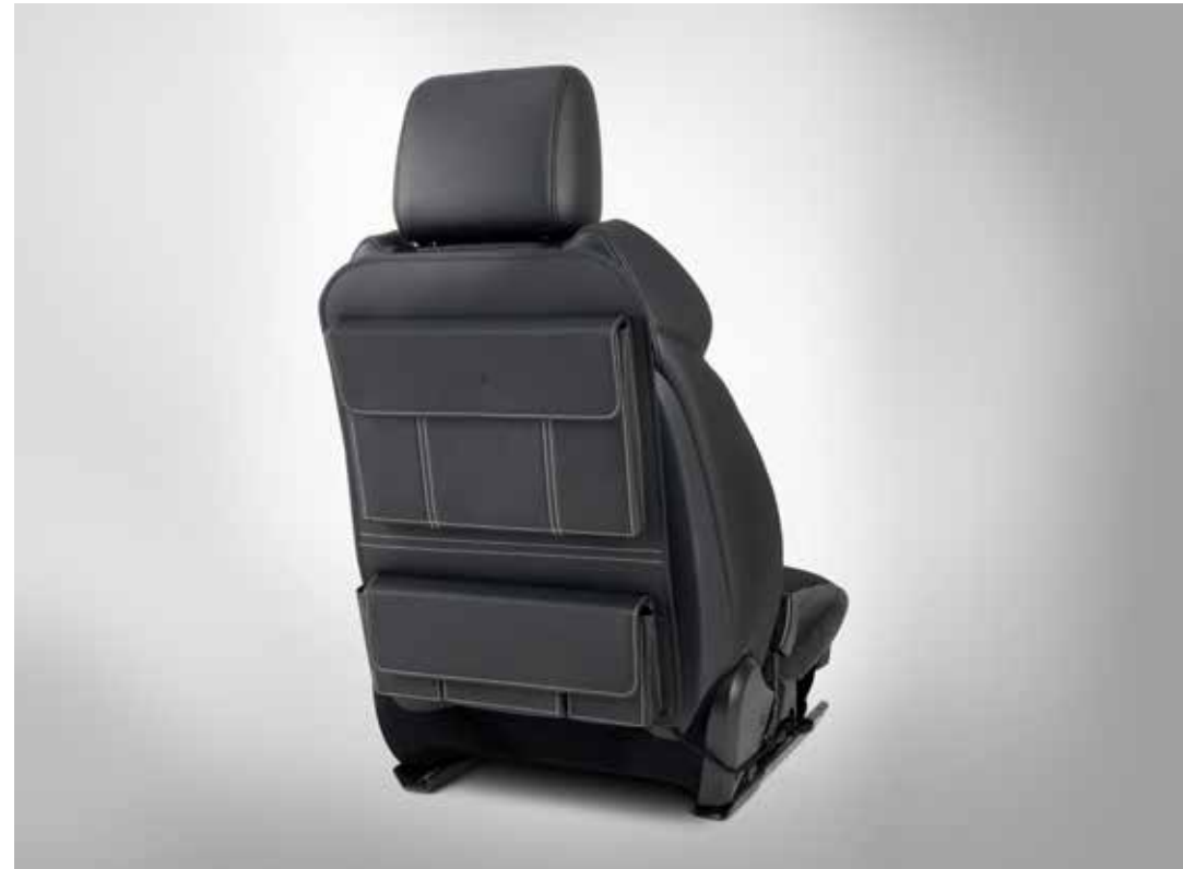
シートバックストイッジ - プレミアムレザー

長期の家族旅行に便利なドリンク・フードキャビネット。上質なレザートップは、センターアームレストとしても使用できます。センターシートベルトで固定し、リアの電源ソケットに接続して使用します。