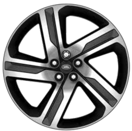
22" スタイル5124、5スプリットスポーク、 グロスダークグレイダイヤモンドターンドフィニッシュ