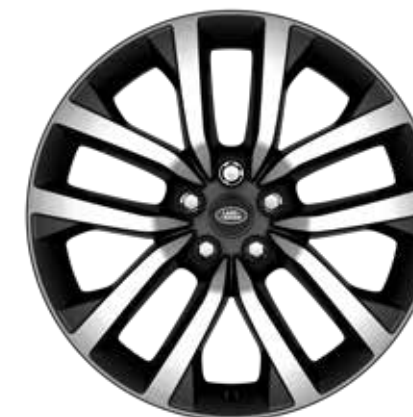
21" スタイル5123、5スプリットスポーク、 グロスダークグレイダイヤモンドターンドフィニッシュ